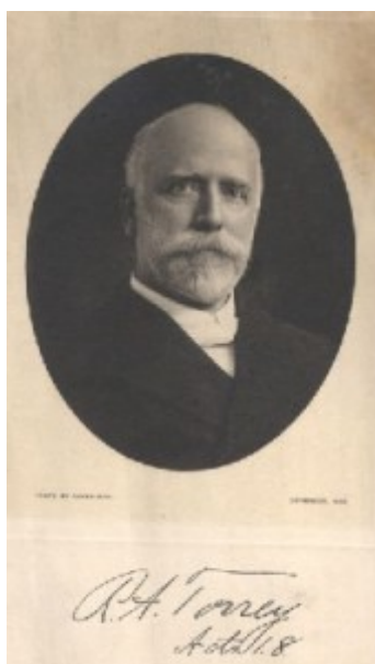
R. A. Torrey

Aber auch von außerchristlichen Bewegungen wurde der christliche Glaube angegriffen. Hier haben sich besonders die neuzeitliche Philosophie , der Darwinismus , der Sozialismus und der Atheismus hervorgetan.