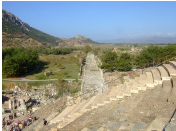
Ephesos: Blick vom Theater auf die Hafenstraße